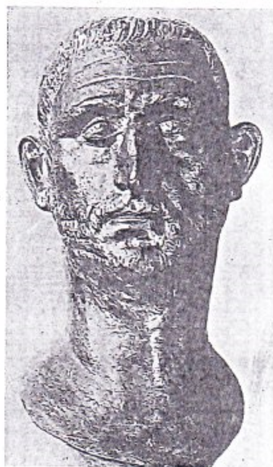
Comparación de los rostros de nuestro togado de Periate, y del retrato de Claudio II "El Gótico" que se encuentra en el Museo de Breszia.

realizada, basándose en fuentes epigráficas, lo cual plantea sus dificultades, ya que conocemos los precios de las estatuas de mármol pero no tan bien el de las de bronce. Según estos cálculos la estatua de Periate pudo costar entre 4.000 y 7.000 sestercios, lo cual equivaldría a medio millón de pesetas en el siglo II. Es probable que esta estimación pueda servir de base para la tasación de la estatua y su indemnización al descubridor, en el fondo, base del conflicto planteado.