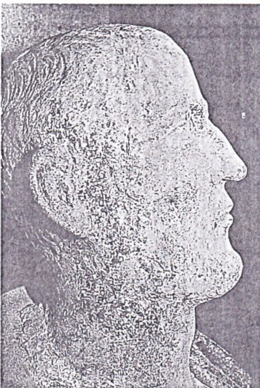
Vista de perfil de la cabeza del personaje togado del Periate.

talleres distintos: uno en Roma, otro en Grecia y un tercero en Asia Menor, siendo de distintos tipos: con coraza, de tipo militar y con toga, del tipo civil, con o sin corona.